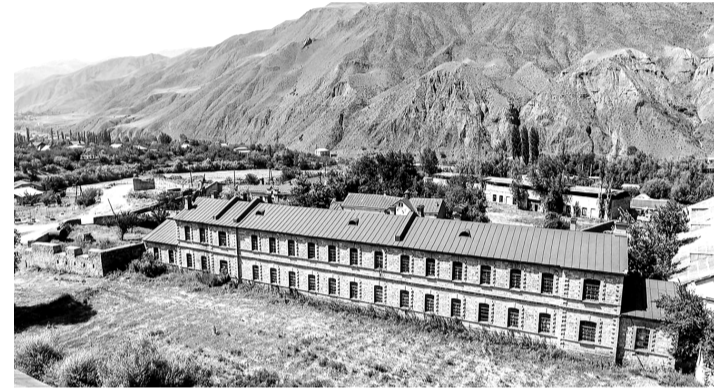
Ахцегърин къеледин къазармаяр

Девирдин истемешунрив къур ва махсус холодильникралди тадаракламишнавай емишрин гъамбархана эцигун.