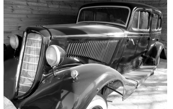
«М-1» маркадин машин чи йикъара