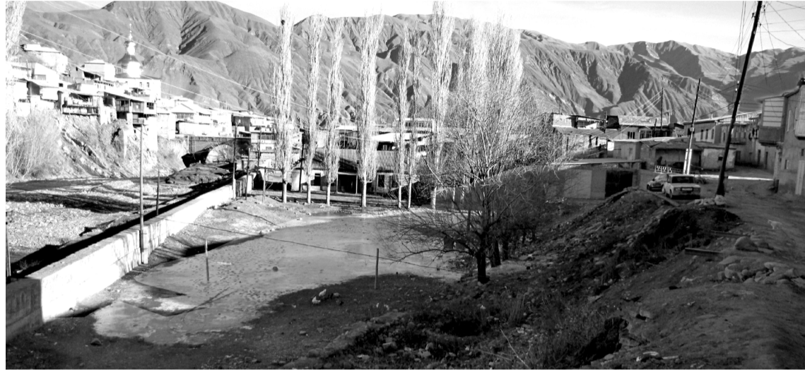
Майдан патал теклифзавай чка (1)

Къуд лагъайди, алай вахтунда вич хуьруьн къене зирзбиллин майдандиз элкъвенвай и чка