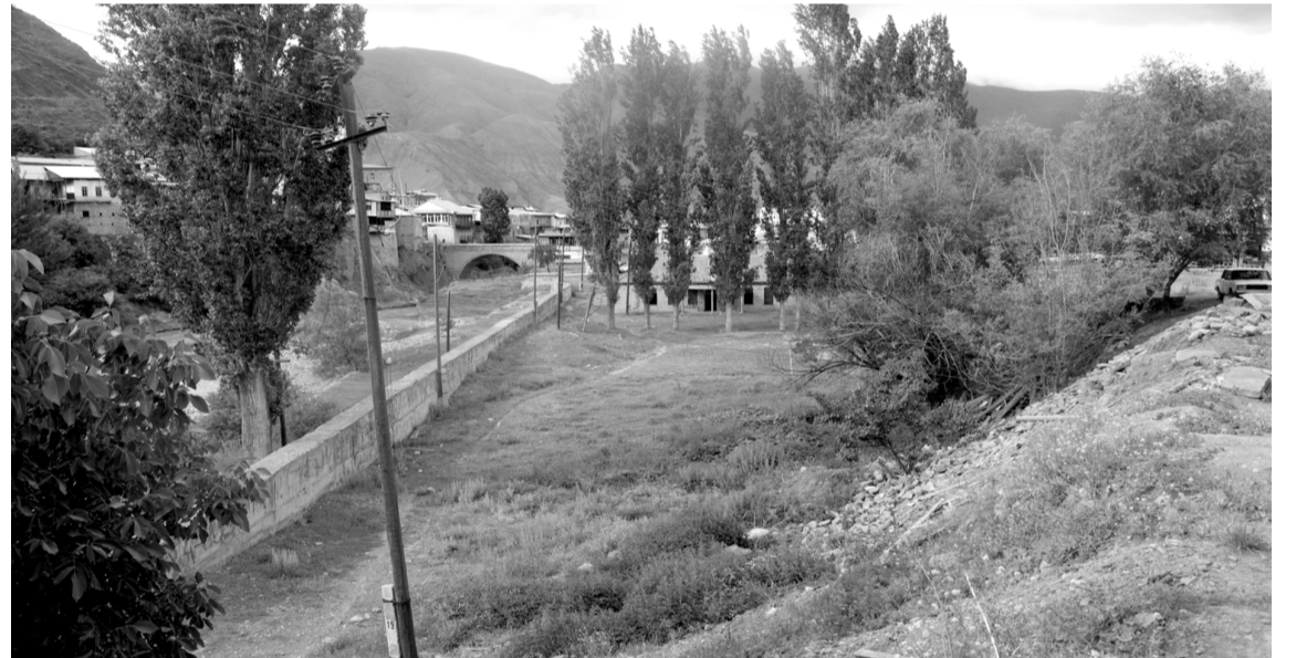
Теклифзавай чка (2)

«Шарвили» эпосдин сувар, адет хъанвайвал, Ахцега, Советрин Создин Игит, лётчик Валентин Эмирован тIварунихъ галай багъда тухуз ва. Къуд патакъай атана, агъзурралди инсанри иштиракзавай сувар патал инаг кутугай чка хъанвач. Вучиз?