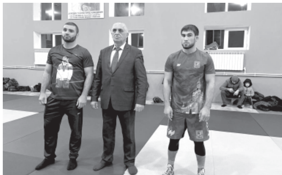
АЗАДДИЗ КЪУРШАХАР КЪУН