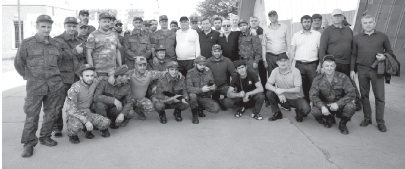
Чечняда авай пунктуна к'ват' хъанвай дяведин рекъый къуллугъ авуниз эвер ганвай дагъустанвиар