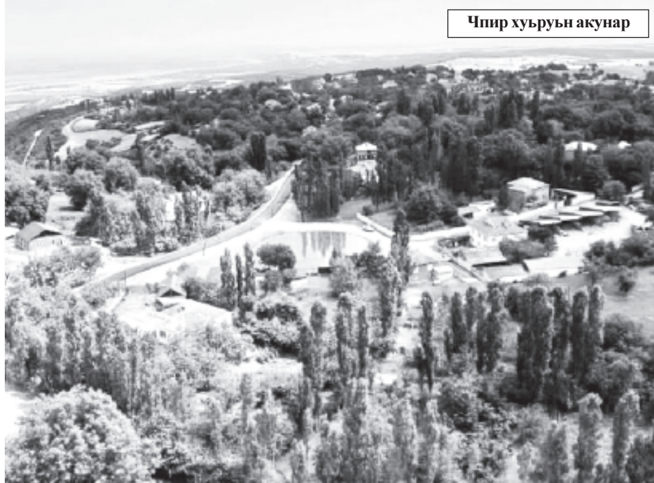
Чпир хуьруьн аьунар