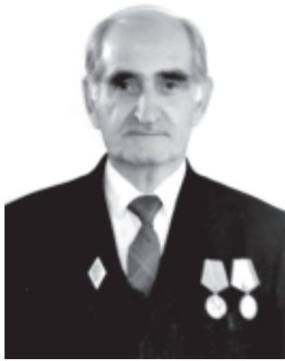
Алхиш сад я: руьгъ-Кубан, вун сагълам хъуй, Чехи арха, ви виш йисар тамам хъуй!

Вун тебрикиз, мукъва-къили шад я къе, Ваз лугъудай гафар ава мад рикле.