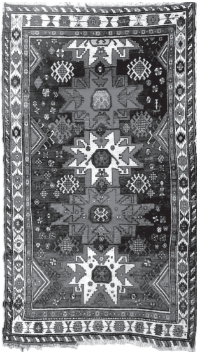
Халича “Лезги гъед”. И нехишди дуьньяда машгул лезги халичайрин жуьре лишанламишзава.

Исятда Дагъустан Республикада чпин асул везифайрик милли сеняткарвилерал машгул тир кархайриз куьмек гун акатзавай государстводин хейлин идараяр арадал гъанва. Инанмивилелди лугъуз жеда хьи, лезгийриз и рекъай, гъайиф хьи, са затни авач. Эгер чун къайгъудик тахъайтла, паталай атана, садни чи халкъдин адетдин сеняткарвилер квалачел ахкъулдиз эгечдач. И месэлада Къиблепатан Дагъустандин вири районри къуватар сад авун, чи халкъдин милли сеняткарвилер арадал хкун патал сад тир милли стратегия туклуьрун чарасуз я. Зи фикирдалди, чи халкъдин чпиз и месэла талукъ тир ксари ва къуллугъчийри милли культура ва искусство вилик тухуник, лезги халкъдин яратмишдай мумкинвилер артмишуник чпин алахъунрин пай кутуни хъсан нетижаяр арадал гъида.