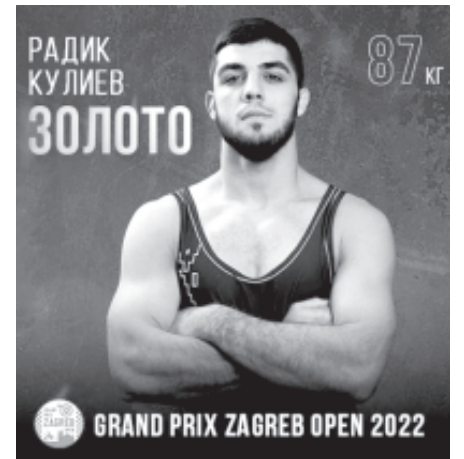
лиева гимидин медаль къазанмишнай. Гъа и йисуз ада Европададин чемпионатдани 2-чка къунай. Алай йисан эвел къилйай Белоруссиядин чемпионатда ада гимидин медаль къазанмишна.

РикIел хкин: чи ватандаш 2009-йисалай Белоруссияда яшамаш жезва. 2015-йисалай инихъ ада уьлкведин хкъанвай командалик кваз международный турнир иштиракзава. 2020-йисузни Радика (87 кг) Белоруссиядин чемпионвилн тIвар къазанмишнай. Спортдин рекъе бегъерлу камар ада 2017-йисузни къачунай: Франциядин меркезда къуршахар къунай къиле фейи дуьньядин чемпионатда Радик Къу-