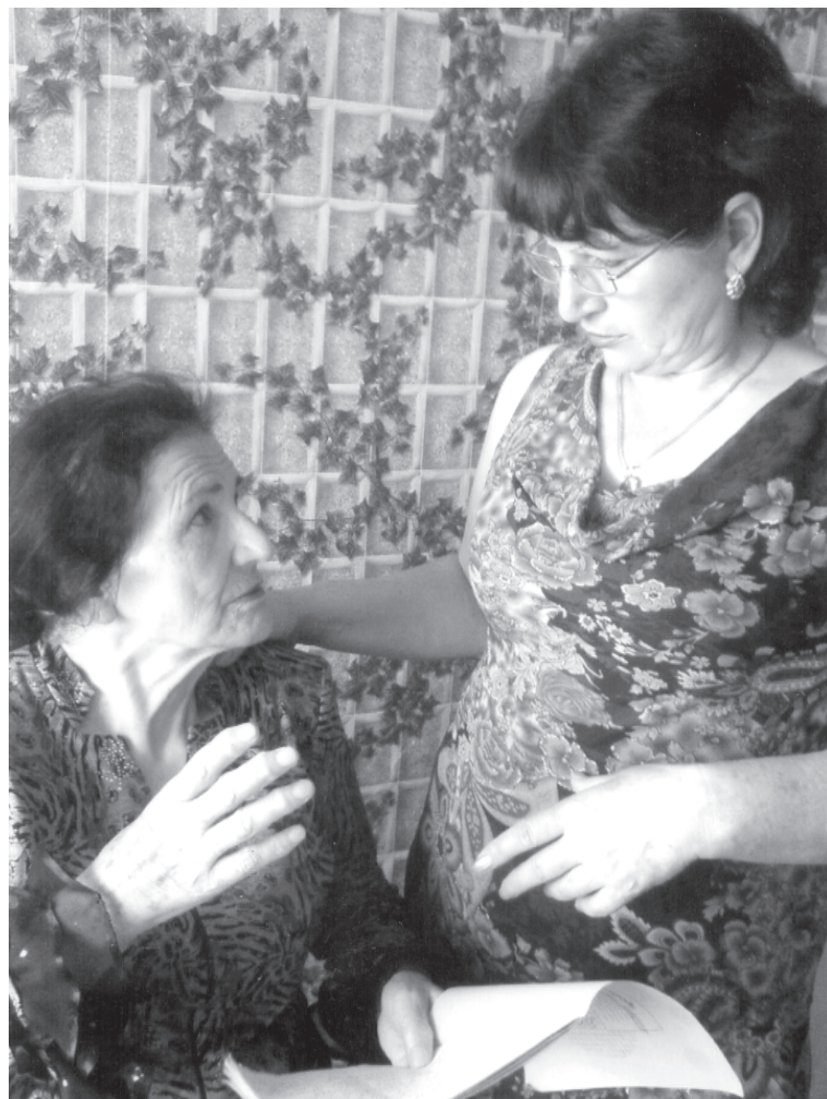
Якъут репетицияда диде Дурнидихъ галаз

Я.Хандадашевадин яратмишунрин биография девлетлуди я. Ам инанмиш тирвал, актерди гьамиша режиссердиз ихтибарна кӀанда. Режиссердиз лагайтӀа, сегьнедин эсер вири битавдаказ