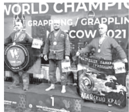
хци спортдин цийи жуьредайни хъсан нетижа къалурна, неинки вичин ватан тир Къурагъар, гъикI вири лезги халкъни шадарна.