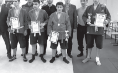
Турнирда гъалиб хъайи ва приздин чкаяр къур спортсменриз медалар, кубокар ва грамотаяр гана.

Мукъвара СтIал Сулейманан райондин Сардархуьре кардик квай дзюдодинни самбодин школадан майдандал самбодай Дагъустан Республикадин КIвенкIвечивал патал акъажунар къиле фена. Ана республикадин шегъеррай ва районрай атанвай 170 спортсменди заланвилин 10 категориядай чпин гъунарар къалурна. Къизгъиндаказ къиле феи акъажунра СтIал Сулейманан райондин командади 1 чка къуна.