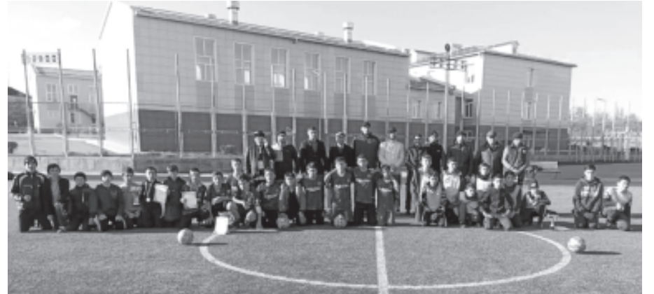
Ярагъ-Къазмайрин хуьре М.Ярагъвидин тварунихъ галай мектебдин футбол къугъвадай члурал къиле тухвай и акъажунра райондин 6 командади иштиракна. Турнирдин тешкилатчи райондин администрациядин физический культурадин ва спортдин отдел тир.