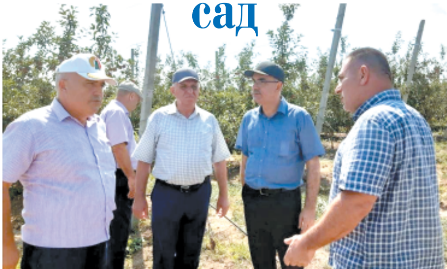
Райондин кьил ва мугьманар карханадин багьлара