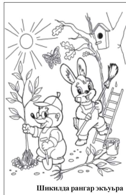
Шикѳида рангар экъуьра