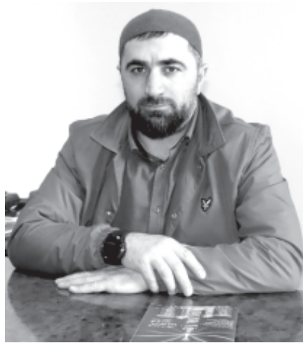
гъят кваллах туш. Ахътин инсанар чи арада, якъин я, са акъван гзафни авач.

Гълбетда, винидихъ гъанвай вири ерийрихъ галаз къазвай кас жагъурун рехъ