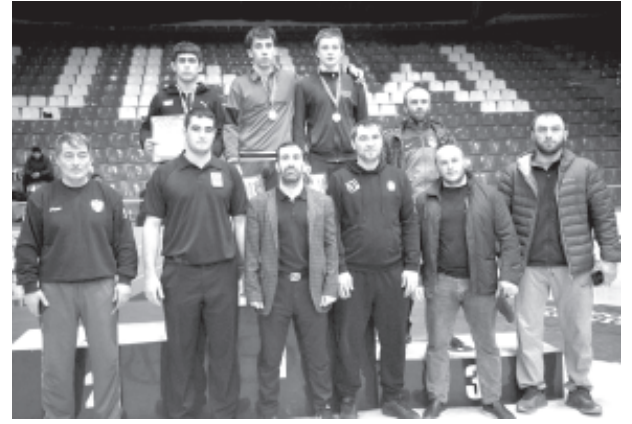
(85 кг) 2-чкайриз лайихлу хъана. Гила абуруди СКФО-дин квенквечивал патал акъажуниз гъазур жезва. Виликди, къегъалар!