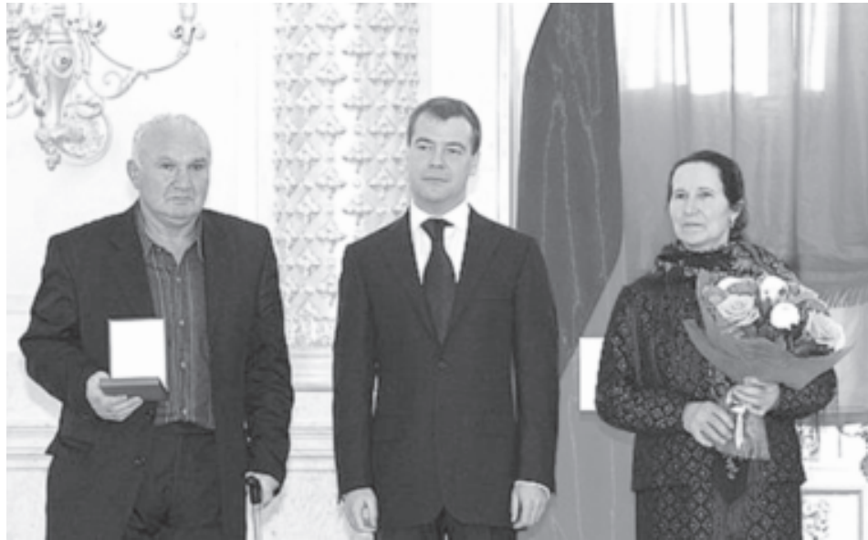
Абдулхаликьав ва Ханперидив медаль вахкай вахт

Халудин патав фена кхезвей жегьилдин кьаншардиз са руш кьезева. Шумал, зериф,