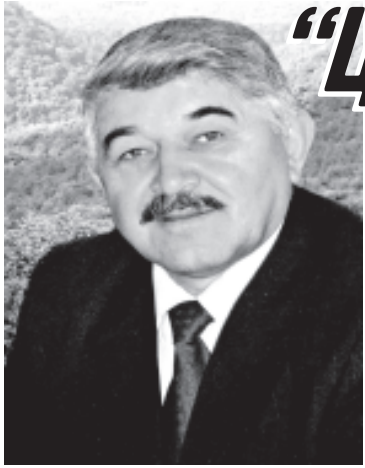
Абдуселим ИСМАИЛОВ, Дагъустандин халкъдин писатель