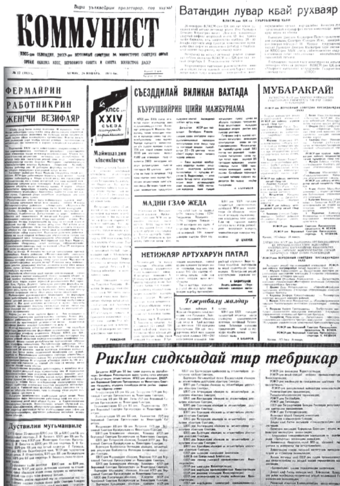
“Коммунист” газет. 1971-йисан 26-январь. №12