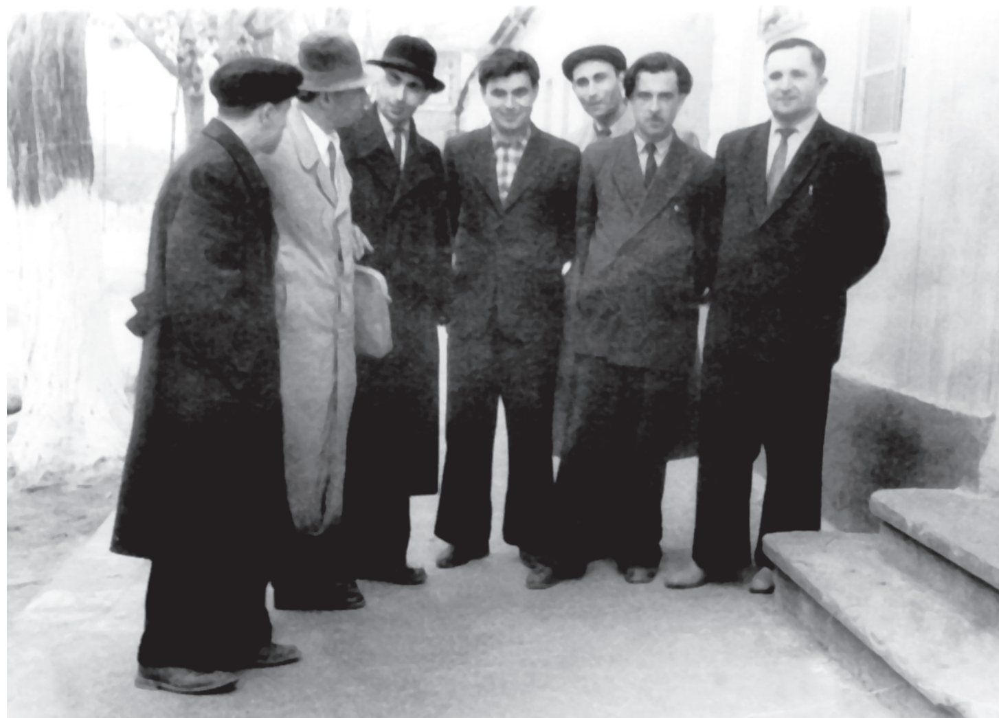
Писателрин са десте