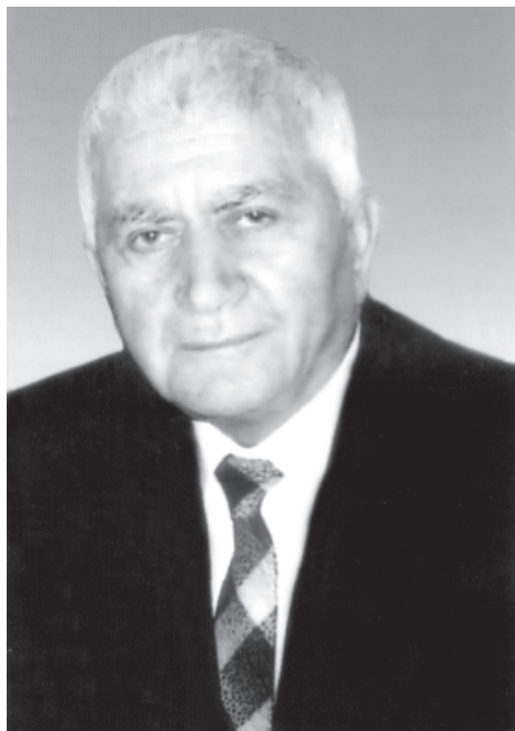
Кичибег МУСАЕВ, Дагъустандин халкъдин шаир