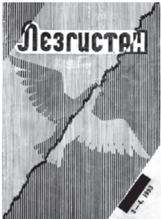
Журнал "Лезгистан", 1993-йис

Гила чун А.Магъадован винидихъ твар къур макъаладал къвен. А макъала акъатайла, парабур автордивай хабар къуна: