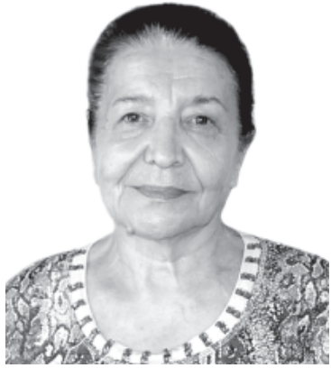
Ханбиçe ХАМЕТОВА, Дагъустандин халкъдин шаир