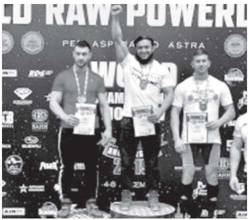
(вири санлай кьурла, 780 кг хжажна) жергеда гьатнава.