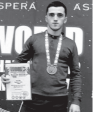
Москвадай вуна ракурна шикил - Шад хъана бубадин гуьгьуьл.

Ваз мубарак и пагъливандин твар, Бубадин дамах, багърийрин даях! Шадвал кутуна мукъвайрин риклерик. КватI хъанва чун, ваз ийиз тебрик. Хва я вун ватандин Европада кьакъан, Ви гъалибвилерин артух хуьрай сан. Чемпиондин пайдах ви кьуьне хуьрай! Фейруз халудин гьил ви гьиле хуьрай, Абдулли юкьваваз, квез агалкьунар хуьрай!