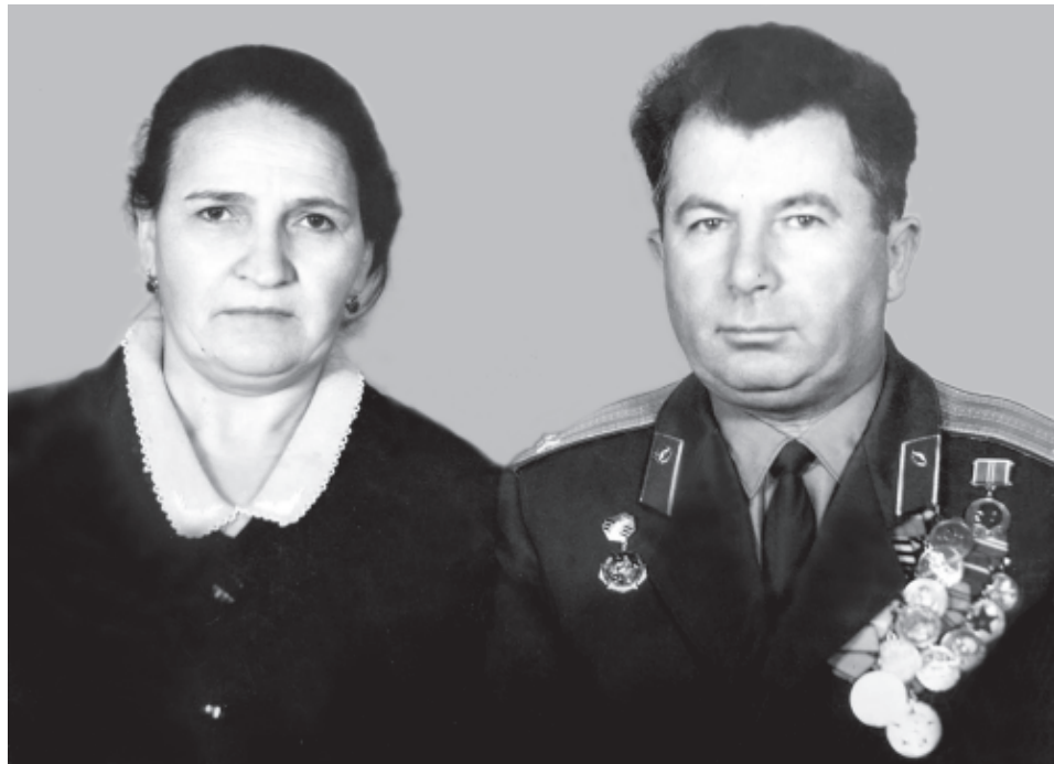
Уьмуьрдин юлдашдихъ галаз

- Зун, чан халадин, 1927-йисуз Докъузпара райондин Мискискарин хуьре зегьметкеш хизанда дидедиз хъана, - башламишна ада вичин ихтилат. - Зи дидени буба колхозчир тир. Чи хизанда 2 стхани са вах авай. Чехи стха Гъасан фронтдиз фена. Ватандин Чехи дяведин цlаярай адаз, гъайиф хьи, элкьвена хизандин патав хтун къисмет хъанач.