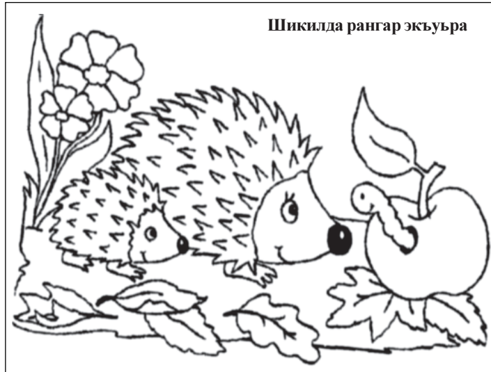
Шикилда рангар экъуьра