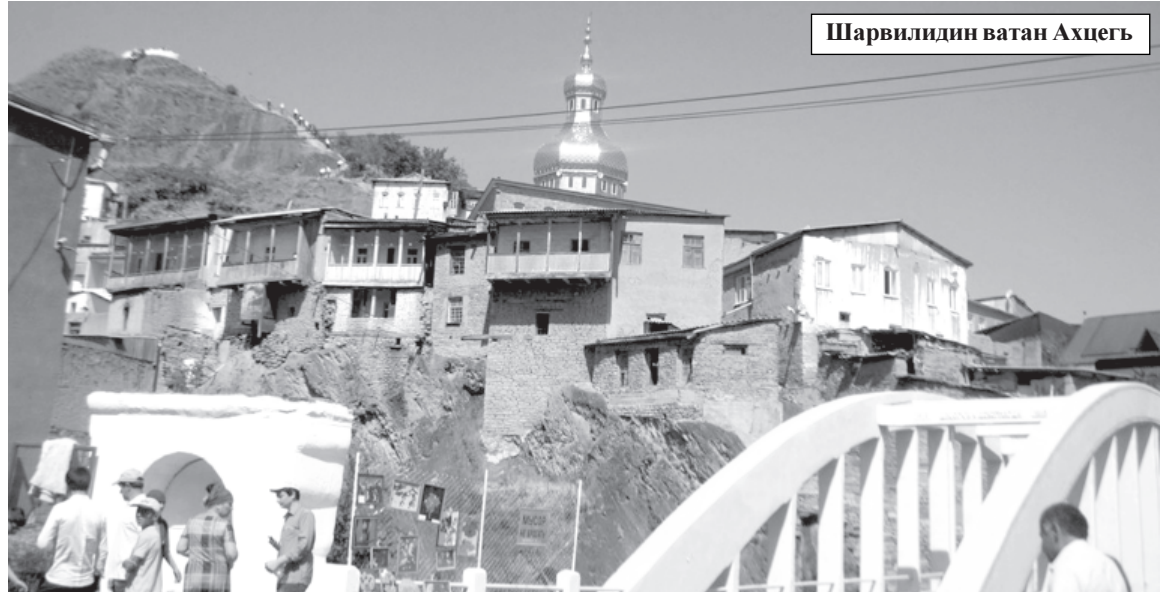
Шарвилидин ватан Ахцегь

Маса сеферда дагьда суьруьдал вегьенвай жанавур вичин къеве гьилегди бамишзава. Ихьтин алааматар акурла, инсанри, иллаки Кас-Бубади адакай зурба пагъливан жедайди гьиссзава. Игит пагъливандиз а вахтара звелни-звел вуч гереқ тир? Гьелбетда, эпосда лагъанвайвал: