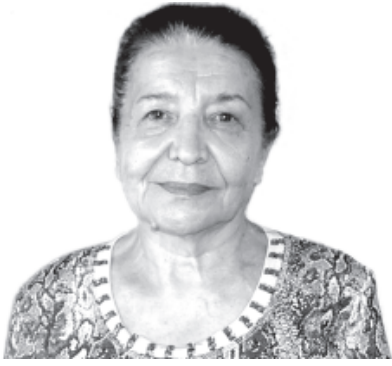
Ханбиче ХАМЕТОВА, Дагъустандин халкъдин шаир