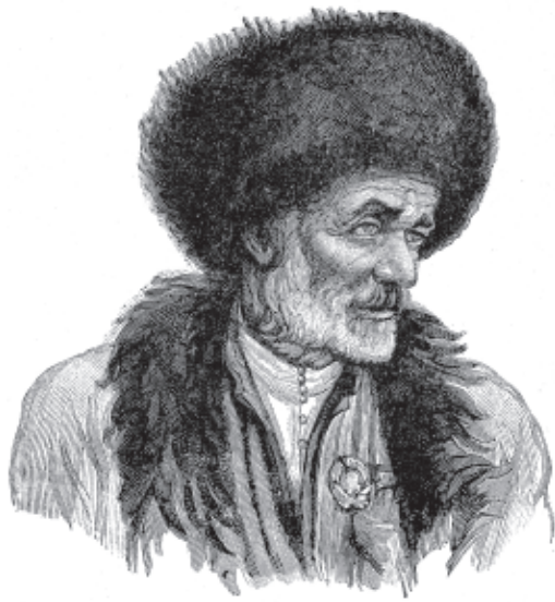
СтIал Сулейманан шикл Чугурди урус художник И.Костыльов я.