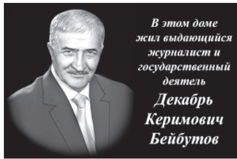
В этом доме жил выдающийся журналист и государственный деятель Декабрь Керимович Бейбутов

ДЕКАБРЬ БЕЙБУТОВ - Дагьустан АССР-да Центральный телевиденидин ва Вирисоюздин радиодин хуси корреспондент. Россиядин Федерациядин ва Дагьустан АССР-дин культуранин лайихлу работник, Дагьустан Республикадин Государстводин премиядин лауреат.