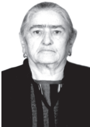
ВАЗ 89 ЙИС ТАМАМ ХЪУН РИКНИН СИДКЪИДАЙ МУ- БАРАКЗАВАЙ ХВА ШАКИР, РУШ РОЗА.

Мубаракрай хайи югъ ваз, Начагъвилер хъурай яргъаз. Яргъи уьмуьр къисмет хъуй ваз, Сад Аллагъди нуьсрет гуй ваз.