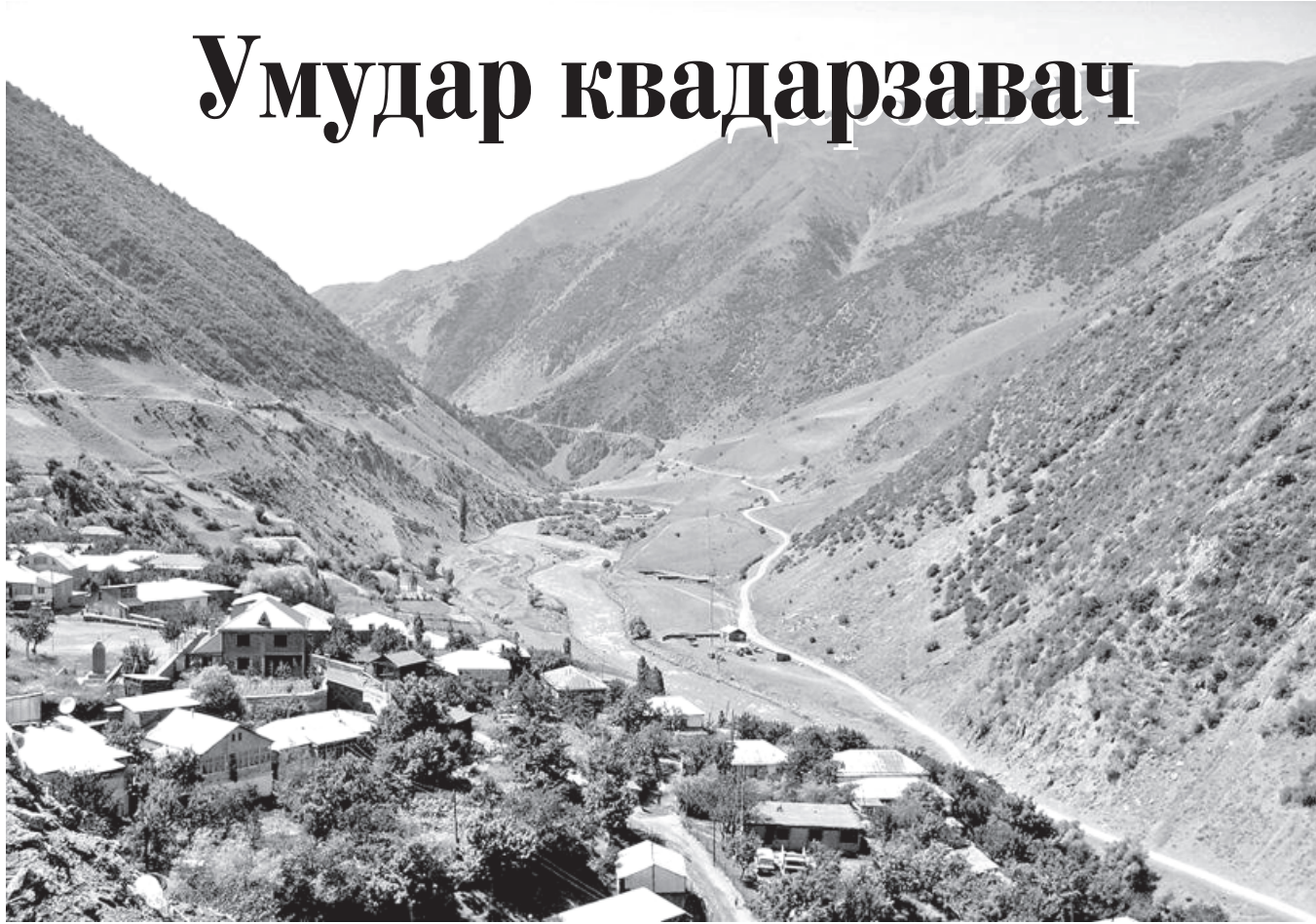
Кинерин хуьр ва Самур вацI