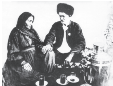
С. Сулейман ва адан юлдаш Айна

Са къариди авур чIиргъин Кас галачиз тIуьн хъана къван. Адан вичин ният якъин Садазни тагун хъана къван.