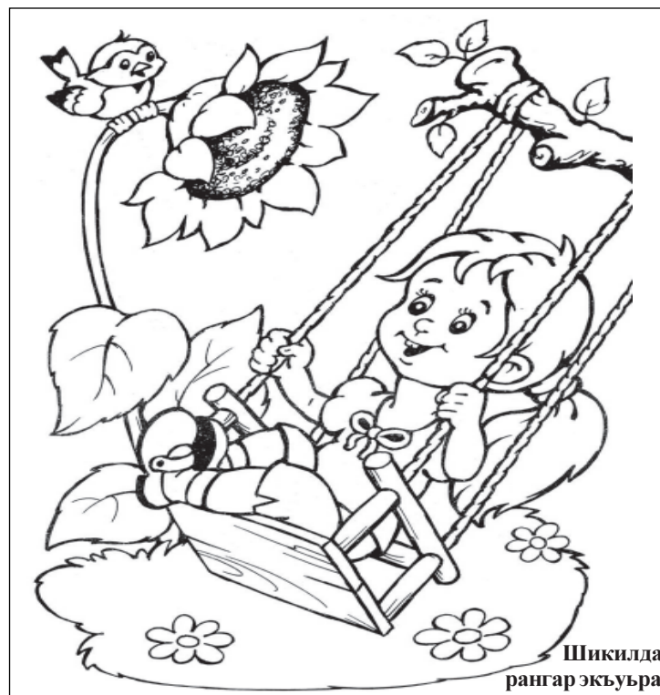
Шикилда рангар экъуьра