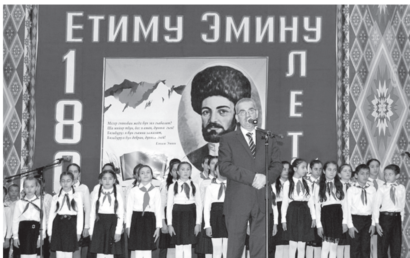
Етим Эминан ирсе хуьн ва гележегдин несилрал агакъарун чи буржи я