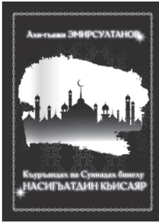
"И ктабда авай къисаяр Къуръандал ва Суннадал бинеламиш хъанва. За абур гъар жуь-