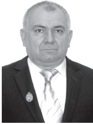
ВАЗ ХАЙИ ЮГЪ МУБАРАК-ЗАВАЙ МУКЪВА-КЪИЛИЯР, ЯРАР-ДУСТАР

Паишманвилер, такъанвилер, Гьич садрани такурай ваз! Ви виш йисан юбилейдик Шад тир тостар дуьгурай ваз!