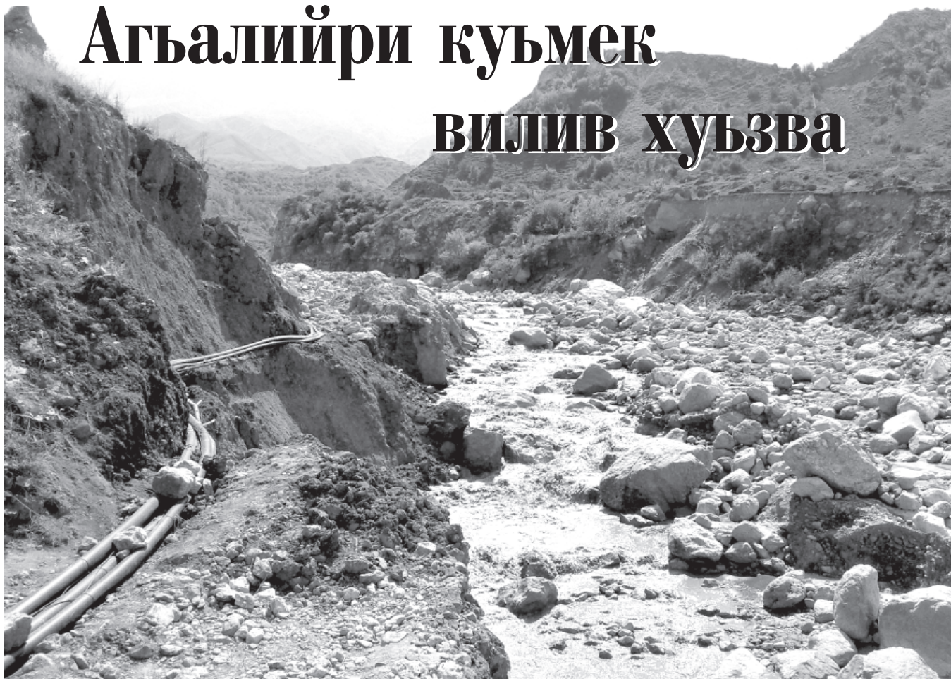
Дигидай цин къаналар къайдадик хуьнлай чкадин жемиятдин яшайишдин шартлар аслу я