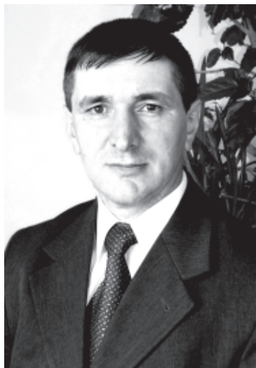
Арбен КЪАРДАШ, Дагъустандин халкъдин шаир