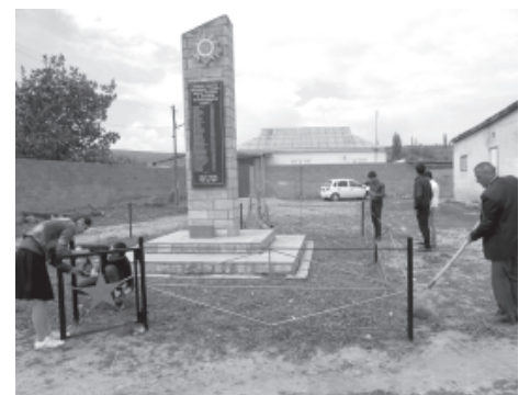
Ученикри ва муаллимри цийи хуьруьн обелиск къайдадиз хкизва

1970-йисуз хуьруьз электордин эквер, 1989-йисуз яд, 1999-йисуз тебин газ гьана.