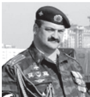
МЕЛИКОВ Сергей Алимович (1965). Генерал-полковник. РФ-дин Милли гвардиядин директордин 1-заместитель. Кеферплатан Кавказдин Федеральный округда Россиядин Федерациядин Президентдин патай тамам ихтиярар ганвай Векил яз хьана.