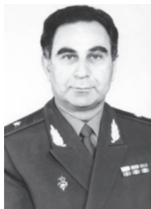
ШАЙДАЕВ Гьажикъурбан Гьажибалаевич (1932). Генерал-майор. Дагъустандин къенепатан крарин министрдин заместителвиле, МВД-дин Вирисоюздин институтдин начальниквиле, РФ-дин Президентдин патав Дагъустандин гьамишалугь векилвиле ва маса къуллугьрал къвалахна.