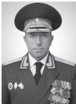
КЪАЗИМЕГЪАМЕДОВ Нариман Магьмудович (1963). МЧС-дин генерал-майор. Хив райондин Къванцилрин хуьре дидедиз хьана. 2008-йисалай инихь РФ-дин МЧС-дин Дагъустанда авай Кылин управленидин начальниквиле къвалахзава.