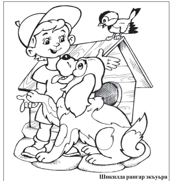
Шикилда рангар экъуьра

*ИГИЛ - Россияда къадагъа авунвай тешкилат.