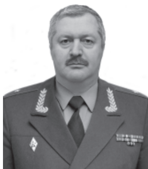
МЕНАФОВ Игит Шагьбанович. Генерал-майор. Ахцегьви.