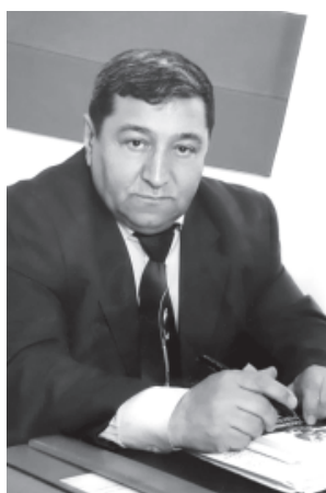
СЕДРЕДИНОВ Зияд Бедирович (1947). Юстициядин генерал-лейтенант. Эсил Фиярин хуьрйя я. Яргьал йисара РД-дин Верховный суддин судьявиле къвалахна.