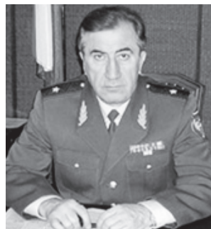
ЧЕРКЕСОВ Азизбег Улубиевич (1951). Генерал-майор. Эсил Докъузпара райондин Макъарин хуьрйя я. СССР-дин КГБ-дин Кылин школа акъалтларна. КГБ-дин органра, РД-да авай УФСКН-дин начальниквиле къвалахна.