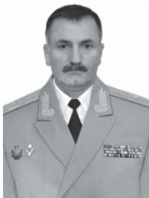
ХЕИРБЕГОВ Забит Сабирович (1968). Россиядин армиядин генерал-майор. Эсил Кцар райондай я.