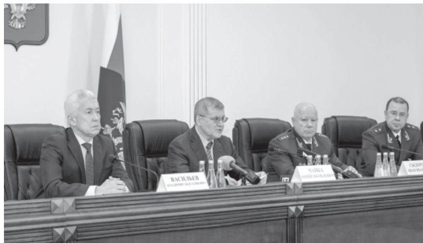
РФ-дин Генпрокуратурадин комиссияди Дагъустанда кьиле тухузвай кIвалахрин нетижаяр къуна