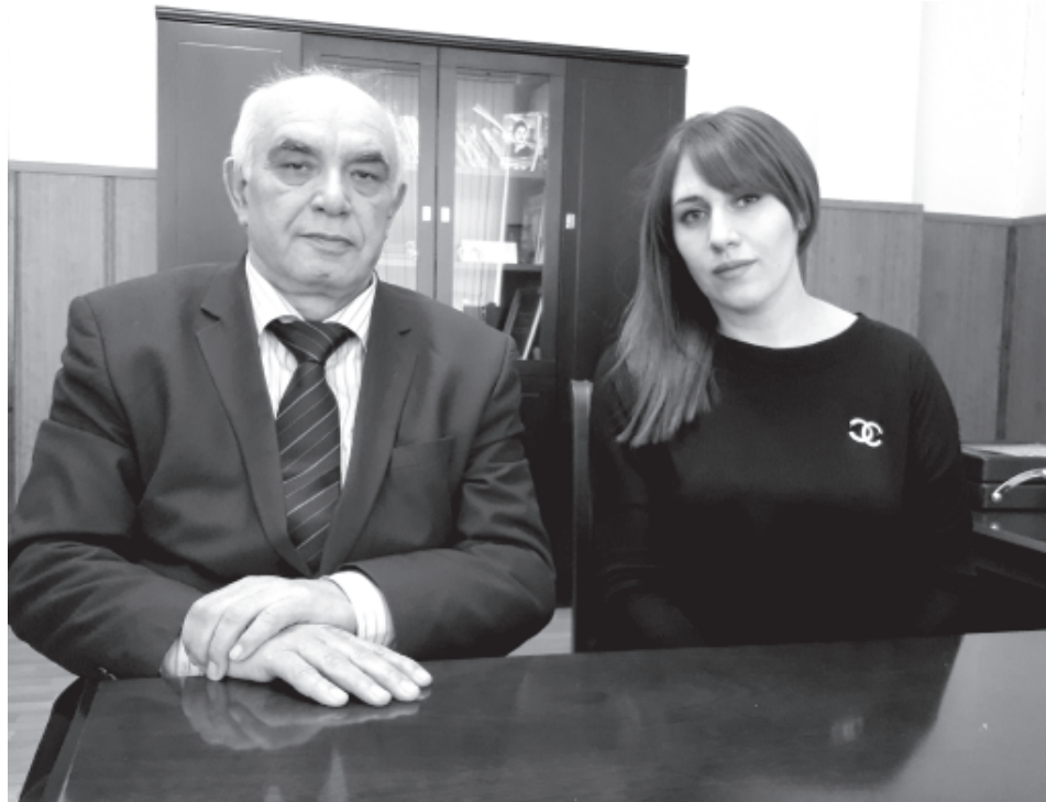
Лезги театр чун садзавай, халкъдин ирс хуьзвай зурба къуват я

- Гъар са регъбердин гъилер, адан куьмекчияр заместителар я. Театрдикай ихтилат фидайла, яратмишунрин коллективдин везифаяр лап чехибур тирди къейдна кьанда. Тамашаяр эцигзавайбур, тамашачийрихъ галаз алакьада авайбур гъабур я эхир. Амма