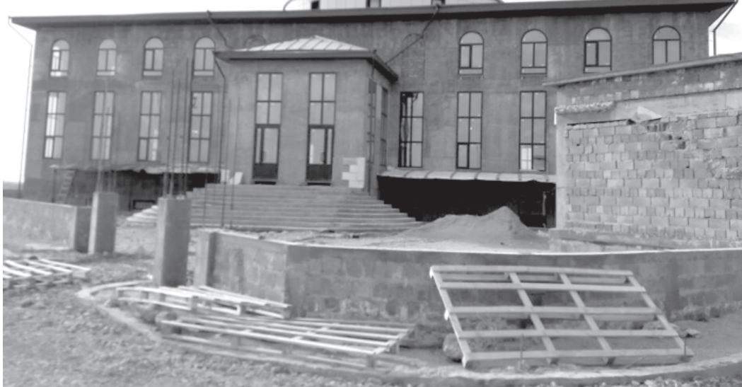
Дараматдин винел патан ақунар