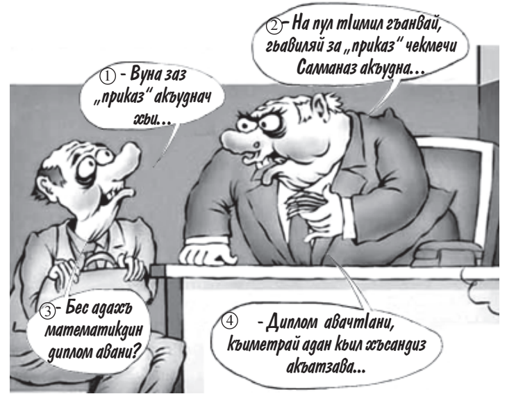
Карикатурадиз баян гайиди Муса АГЪМЕДОВ я.