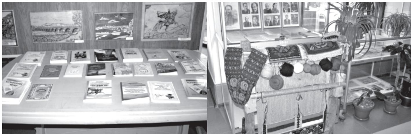
Милли эдебиятдиз, медениятдиз талукъарнавай выставкаяр итижлур тир