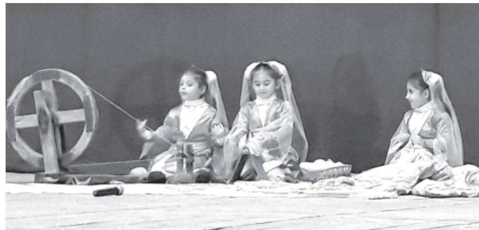
"Чубарук" бахчадин бицекри лезги чӀалан сувар мадни гурлу авуна

Конференциядал райондин мектебра кӀелзавай аялри, муаллимрин дестейри, Россиядин халкъарин адетдин культурарин центрадин векилри лезги чӀалал ши-