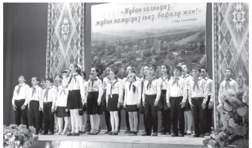
Дидед чIалан гележег акъалтзавай несилрин гъиле ава