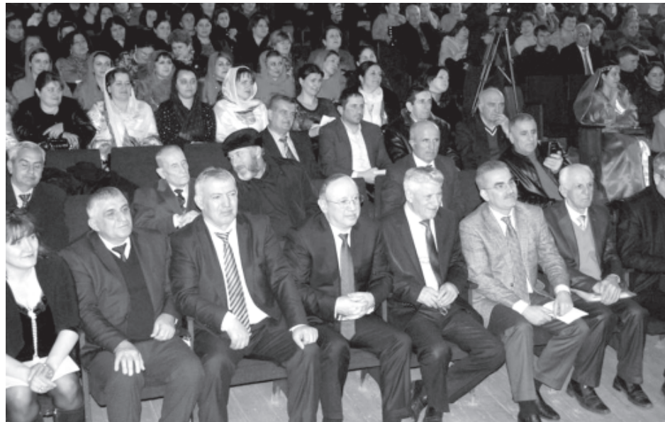
АцӀанвай залди мярекатдин важиблувилкай лугъузвай

Къейдна кӀанда, "Шарвилидин гуьмбет" фондунин района кӀиле тухузвай гъар са мярекат тешкилуниз пулдин такъатралди кӀумекар, анра гъалиб хъайибуруз премияр гузва. Гъа и къайдада хайи чӀал, литература, меденият еримлу хъуник къетӀен пай кутазва. Милли девлетрив, руьгъдин ивиририв къайгъударвилелди эгечӀзавай фондунин кӀиле акъвазнавай ватанпересар баркалландиз, чешне къачуниз лайихлу я!