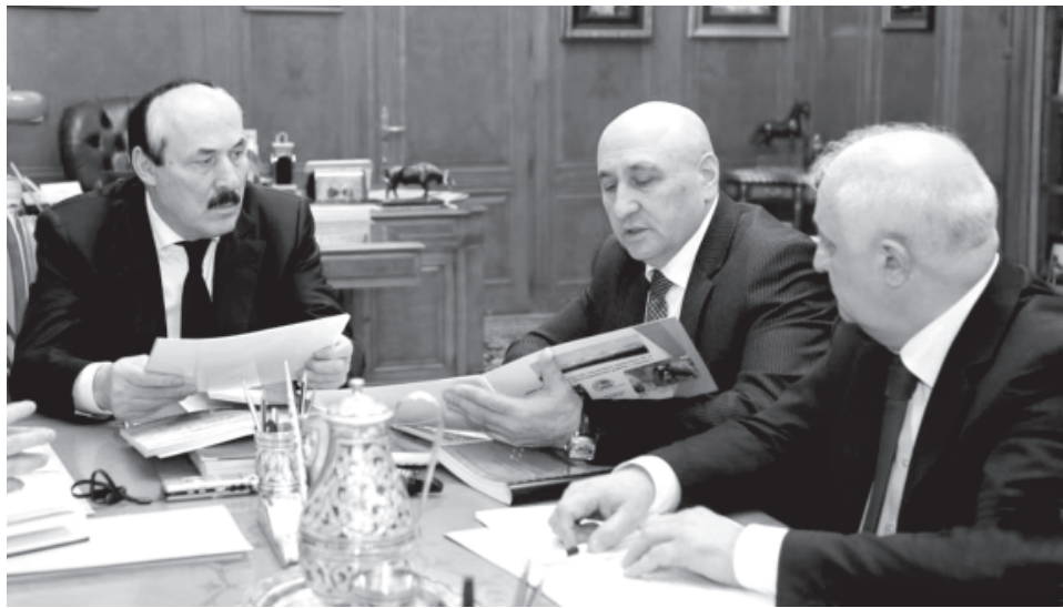
РД Къилин ва Гьукуматдин пресс-къулугъдин шикил

Къимет “Дагпечатдин” киоскрай - 16 манат