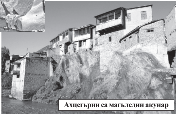
Ахцегьрин са магьледин ақунар

- Заз куй фикир Ахцегьрин куьгьне магьлей-