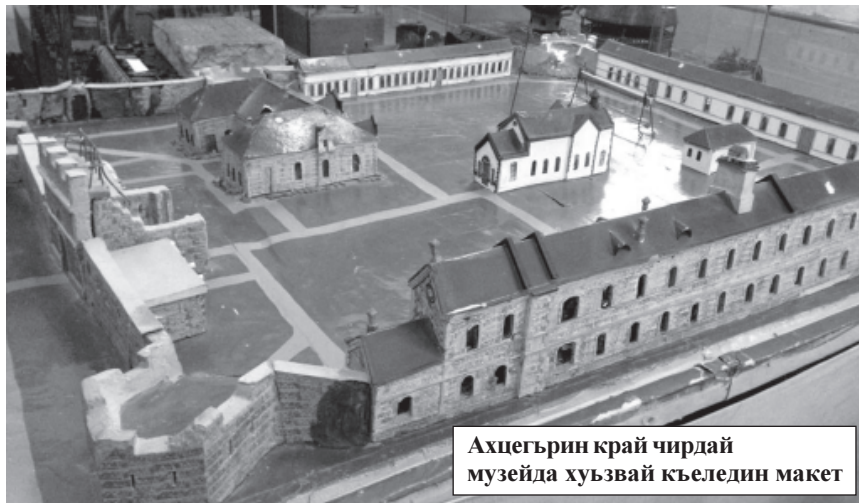
Ахцегърин край чирдай музейда хуьзвай къеледин макет

И къеледихъ галаз чи тарихдин зурба чинар алакълу я. Ана лезгийриз светский сифте школа, Самур округ патал школа-интернат хъана. Бес ана машгур гуькван ксар тербияламишна?! 1920-1930-йисара къеле дустагъдиз элкьурнай, 1980-йисара, гъар жуьре тадарак эцигна, къеледа радиозавод кардик кутуна. Ахпа халкъди ишлемишдай метягъар арадал гъидай завод хъана.