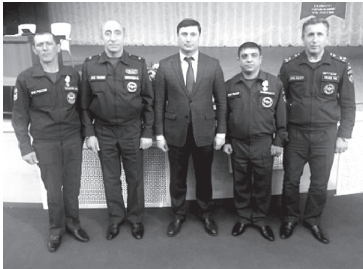
Виклегъ пожарныйярддин Гьукуматдин Председателдин заместитель Билал Омарова тебрикна