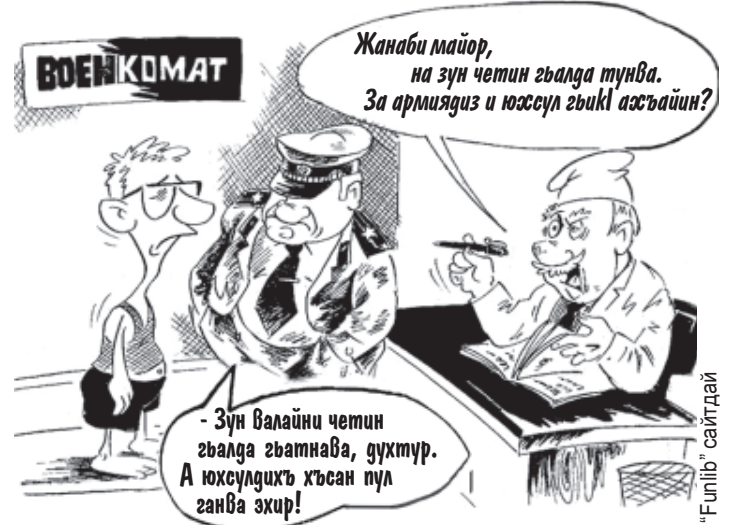
Карикатурадиз баян гайиди Муса АГЪМЕДОВ я