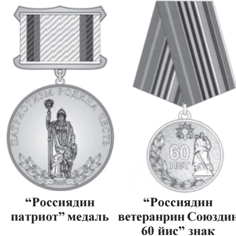
"Россиядин патриот" медаль "Россиядин Союздин 60 йис" знак

- "2016-2020-йисара граждана патриотвиллин руьгьдаллаз тербияламишун" госпрограмма уьмуьрдиз куьчурмишунал чна хъсан гьазурлухвал авай активистар - дяведин, зегьметдин ветеранар, пенсионерар ва уьмуьр