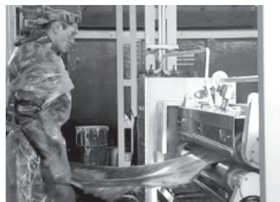
Хам гьалзавай вахт

Эхиримжи йисара сифте сеферда яз ва государстводинни хусуи карханайрин амадагвилдин бинедаллаз Ногъай райондин Терекли-Мектеб хуьруьн патав, Туьркиядай тир инвесторин иштираквал аваз, хамар ва хъицикьар гьалдай цехдин дарамат хкажнава. Лагьана кланда хьи, и цехда хамар ва хъицикьар тамамдаказ ваь, анжах сифте лазим тир жуьреда гьалда, идалай къулухъ абур Туьркияда авай цех-