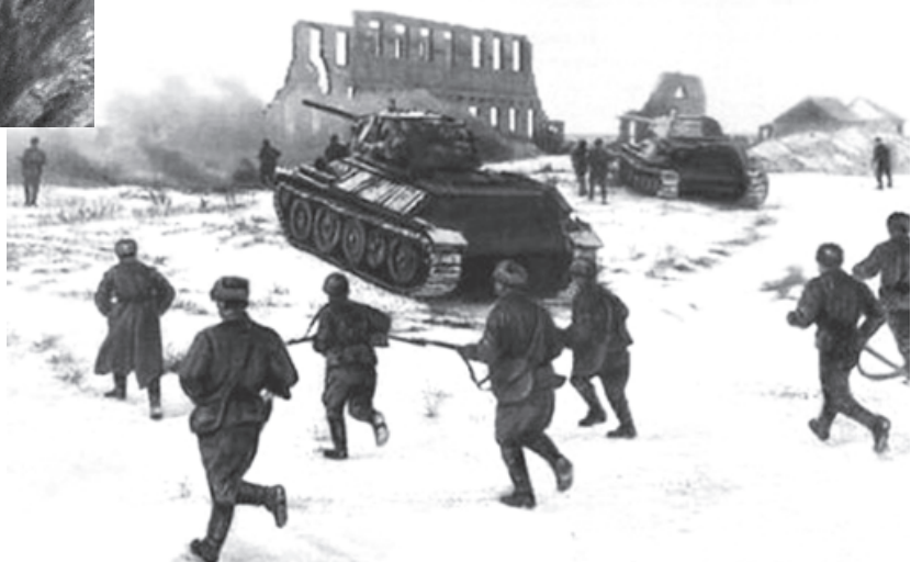
Калачдин патав чи аскерин гъжум

1943-йисан 10-январдиз советрин къушунри "Кольцо" твар ганвай операция башламишна. Гъикъван алахъунар авунатлани, немсерин къушунривай Гитлеран истемешун килиз акъу-