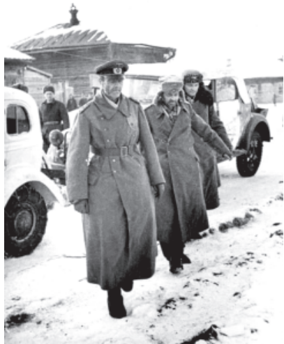
Есирвиле къунвай Паулюс

1941-йисан декабрдиз Москвадин патарив фашистрин зурба къуватар дарбадагъ авуни, душман чир меркездивай 400 километрдин рагъакьидай патахъ гадар хъувуни Гитлеран Германияда ва армияда еке велвела тунай. Ада вичин хейлин генералриз "ягъун къунай". ИкI, къураматдин къушунрин главнокомандуюй, армиядин "Центр" группадин командуюй ва са жерге маса военачальникар (35 кас къван) алай къуллугърилай алуднай.