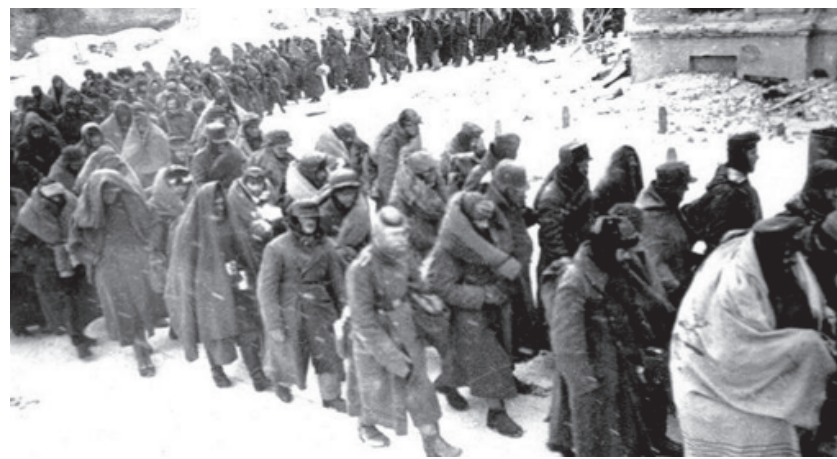
Немсерин 6-армия гьалкъада

Арадал атанвай члугур гьалар фикирда къуналди, 1942-йисан 14-июлдиз ЦК-дин Политбюродин Сталинградский областда военный гьалар малумарунин къарар къабулна. И шегъердиз Политбюродин членвиле кандидат, ГКО-дин член Г.М. Маленьков, ЦК-дин член, СНК-