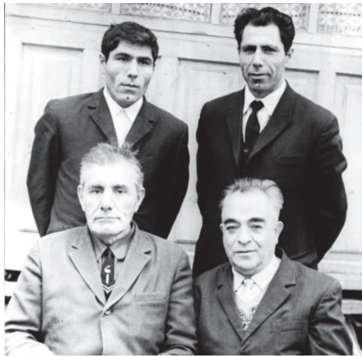
М.Къуруш, Ш-Э.Мурадов (вилик жергеда), квалачел акъвазнавайбур: Синдбад ва Малик (М.Къурушан рухвайр)