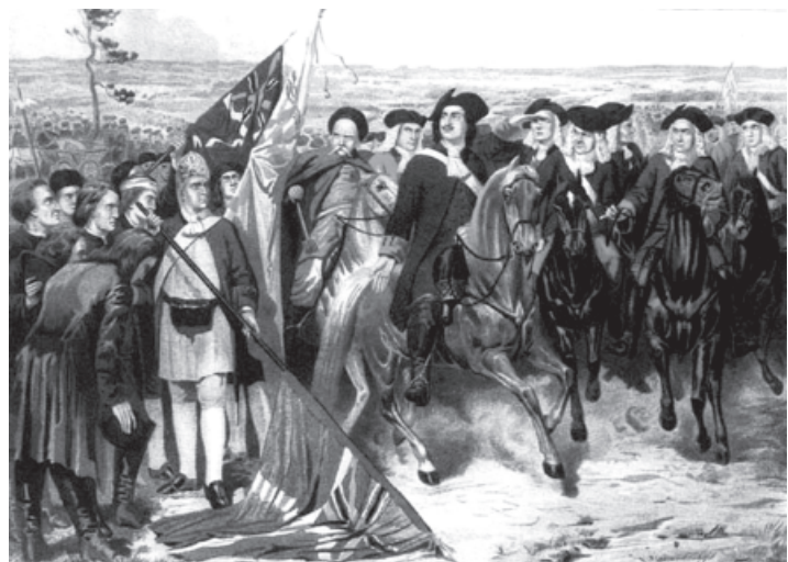
Шведри рей гун

Россиядин тарихдиз вил вегейтга, аквада хьи, чи уьлкведин халкь лап дегь заманайрилай инихь кьиле фейи дявейрин, инкьилабрин, чилер, сергытар гегеншарун патал жуьреба-жуьре женгерин шагь-идар хьана. Амма чи халкьар, вири сад хьана, Ватан хуьз кьарагьна, Россия кьуватлу авуна, армия мягкемарна. I Петр кьиле аваз урусрин, XII Карл кьиле авай шведрин армиядин Полтава патал кьиле фейи женг Кеферпатан дяведа виридалайни члехи женг яз гьатнава. И женг 1709-йисан 8-июлдиз Полтавадин патав, Украинадин чилел, Днепр вацун чапла пата кьиле фена. И дяведа Россиядин кьуватар гьалиб хьуни Европада машгур хьанвай шведрин армияди агьавал авунал эхир эцигна, Россиядин авторитет хкаж хьана.