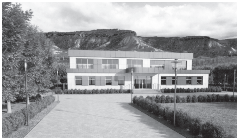
Зулухъай инаг къацу кул-кусар ва тарар цана туькьурда