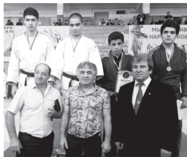
Жаван спортсменар багъа мугъманрихъ галаз

Турнирда 1, 2 ва 3-чкаяр къур спортсменриз, талукъ тирвал, 5000, 3000 ва 1000 манатдин къадарда аваз пулдин призар, медалар ва дипломар гана.