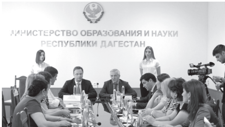
Республикадин школяр учебникралди таъминарунин дережа 40 процентдилай са живи артух я