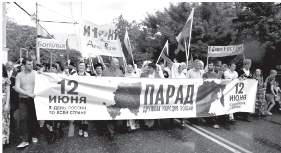
Россиядин югъ Дагъустанда шад гьалара къейдна

И вахтунда “Дуствилин кIвале” Вири- россиядин “Чун - Россиядин граждaнaр” акциядин лишандик кваз жегилрив пас-