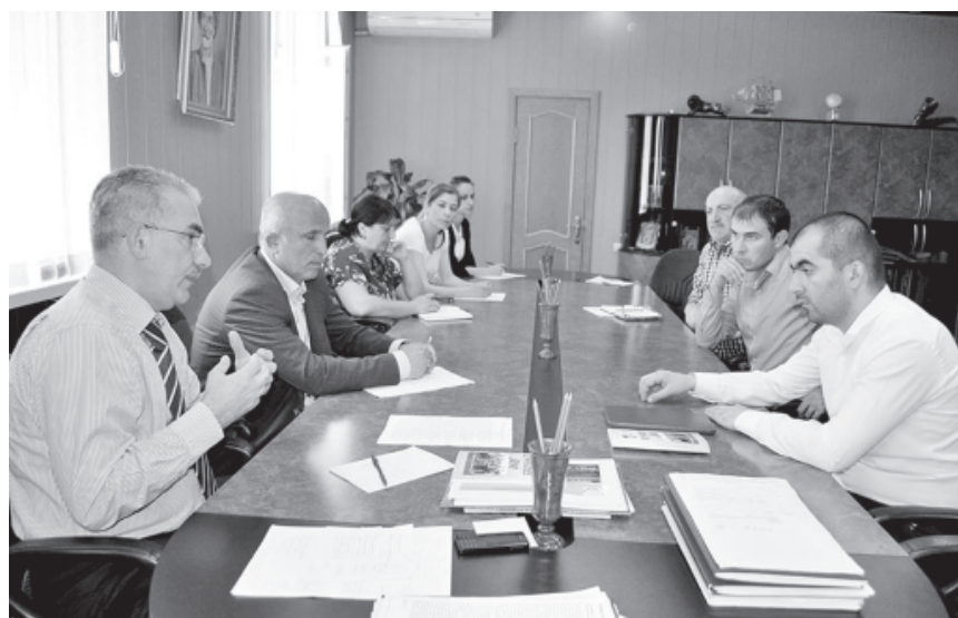
Сулейман-Стальский района алай йисан 1-паюна "Лезги газет" 2047 касди кхъенвай