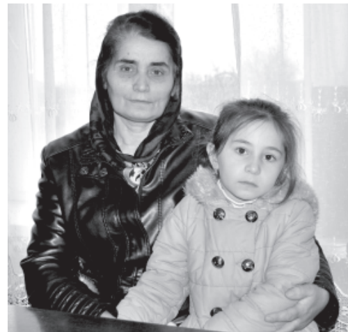
А.Рагъимханова хтул Периханум гваз

Лугъуз жеда хьи, дагъви дишегълиди вичиз халкъди авур ихтибар намуслудаказ кьилизни акъудна.