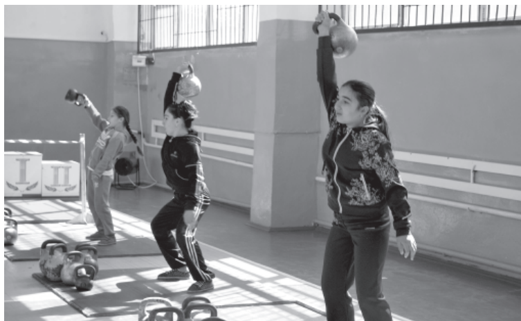
Жаванри чпин устадвал къалурзава