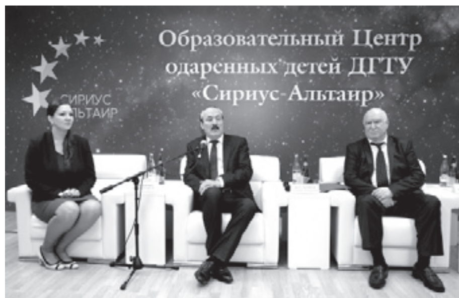
Шкил - РД-дин Къилин ва Гьуметдин пресс-кълугъдин

24-мартдиз Дагъустандин Къил Рамазан Абдулатипова бажарагълу аялар патал тайинарнай, чирвилер гудай “Сириус-Альтаир” центр шадвилер гьалара ачухунин мярекатда иштиракна. И центр Дагъустандин государстводин технический университетдин бинедаллаз тешкилнавайди я.