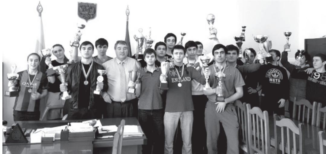
Школа машгьурзавай пагьливанар ва директор