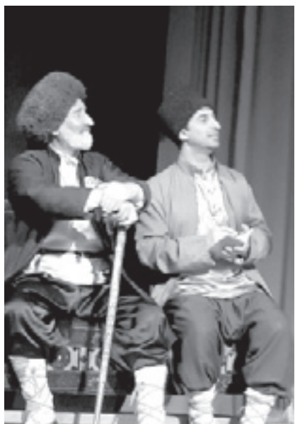
Шаирдин “чан алай къамат”