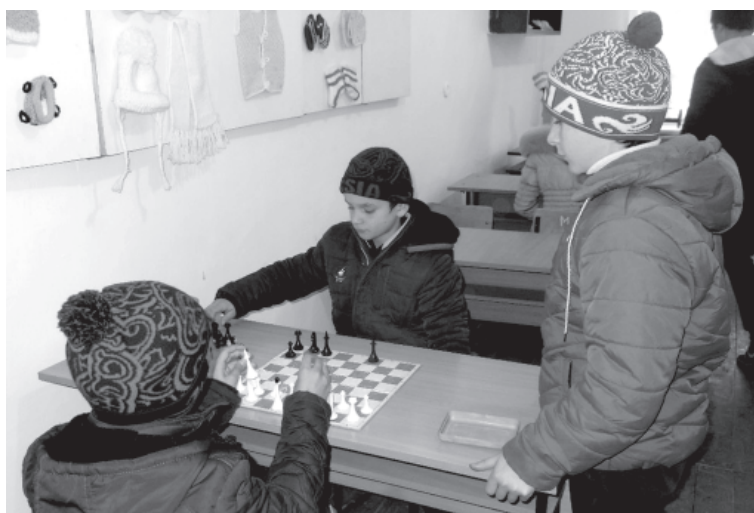
Акъажунар кыле физвай вахт