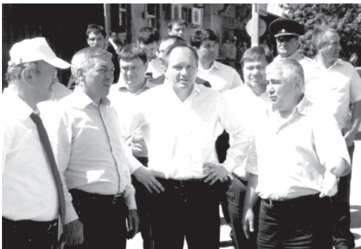
Кеферпетан Кавказдин краай РФ-дин министр Лев Кузнецов (юкьва) ва адахъ галай ксар цийиикла туьхкюьр хъийизвай объектриз килигзава

Самур там тлебиатдин мужидат я. Ам Къиблепатан Дагъустандин гевгъер яз гъисабзава. Ихътин там Россияда мад санани дуьшуьш жезвач. Самур тамун успагъивилихъ сергъатар авач. Тама тек-туьк аквадай тарар гъалтзава. Абурун яшарни асиррилай пара я. Самур тамун сергъатра гъамга ятар авахъзавай цудралди булахар, жуьреба-жуьре балугъри сирнавазавай къарасуяр авахъзава. Иниз атай туристри Самур там махарик жедай суьгъурдин вилаятдив гекъыгзава.