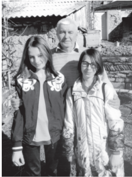
Назим хтулрихъ (Амина, Аза) галаз

ДИПЛОМ къачур жегьил Марийский АССР-дин Оршан райондин больницадиз рекъе туна. Инаг 6 агъзурдав агакъна инсанар яшамиз жезвай поселок тир. Районда 15 агъзур агъали авай: марийвиар, урусар, татарар, чувашар, удмуртвиар ва гъакл маса миллетар. Агъалияр хуьруьн майишатдал машгъл жезвайбур тир. Гъавилляй Назим