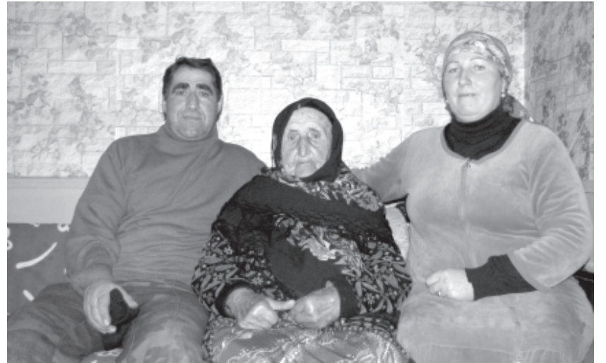
Зелиха баде хва Хейбарахъни свас Гуьлназахъ галаз

Аферин, абурулай чпин веледар зегъметдал рикл алай, чехи-гъевчи чидай халис инсанар, пешекарар яз тербияламишиз, гъардаз вичин къвалюгъ кутаз алакънава. Чехи хизандин хъсан адетар лайихлудаказ хтулрини птулри давамарзава. Алатай вахтар гагъ хъвер, гагъ шел кваз рикел хъиз-