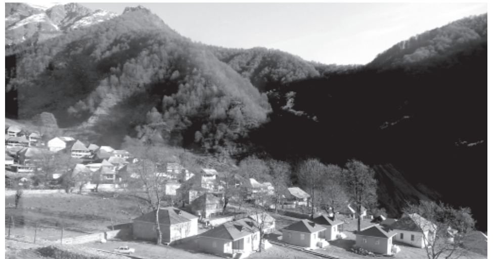
Дуружа хуьруьн акунар