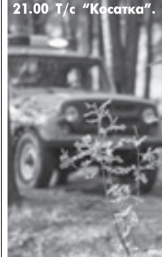
21.00 Т/с «Косатка». (12+).