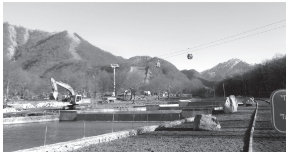
Канатдин рехъ ва кланик вацл муьтгьуьгарнава

лов Султан буба рахурзава. Муьжуд велединни цудалай пара тухларин буба, зоотехник-виллин 40 йисан тежриба авай зегьметдин ветеран, гъавурдик квай хъсан суьгьбетчини я.