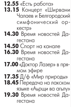
21.35 Т/с «Тест на беременность». (16+).

11.00 «Документальный проект»: «Зеленый Солярис». (16+). 12.00 «Информационная программа 112». (16+). 12.30 «Новости 24». (16+). 13.00 «Звонкий ужин». (16+). 14.00 «Засуди меня». (16+). 15.00 «Семейные драмы». (16+). 16.00 «Не ври мне!» (16+). 17.00 «Не ври мне!» (16+). 18.00 «Верное средство». 19.00 «Информационная программа 112». (16+). 19.30 «Новости 24». (16+). 20.00 Х/ф «Дом Большой Мамочки». (США - Германия). (16+). 21.50 «Смотреть всем!» (16+). 23.00 «Новости 24». (16+). 23.30 Х/ф «Дом Большой Мамочки». (США - Германия). (16+). 1.20 Х/ф «Сотовый». (США). 3.00 Т/с «Туристы». (16+).